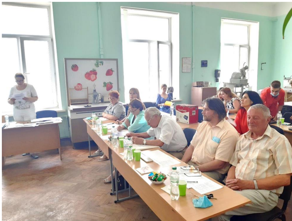
Захист дипломних проектів, 23 червня 2021 року, СВО «Бакалавр», спеціальність 162 «Біотехнологія та біоінженерія», ОПП "Біотехнологія", кафедра біоінженерії і води